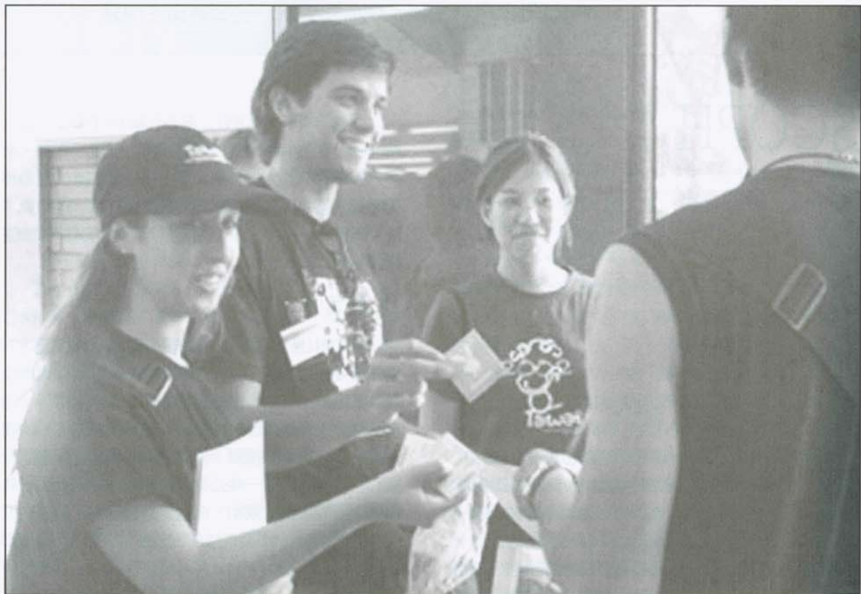
▲ SCORA 的成員帶著外國學生到西門町發送保險套

SCORA 每個年度最主要的工作就是 ICE， 在各校舉辦的大規模展覽活動， 推行愛滋病防治的教育常識， 以及最基本的防制措施——保險套的使用。