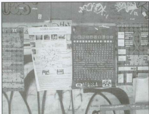
▲ SCORA 張貼在西門町的宣傳海報

動，推行愛滋病防治的教育常識，以及最基本的防制措施——保險套的使用。ICE的重要性不再僅限於節育上，對於愛滋病防治的推行也有著很重要的地位。